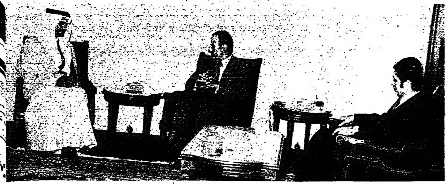
الرئيس الاسدي استقبله امير سمود فيصل وزير الخارجية السورية، بحضور السيد عبد العظيم خدام

تحدثت معاً في نية صافية نحو تنفيذ المرحلة الثالثة من اتفاق شتورا المتعلقة بالوضع في هذه المنطقة، من أجل انهاء الجبهة اللبنانية في لبنان، ولا تشكك ان احدا على الساحة اللبنانية يريد غير ذلك.